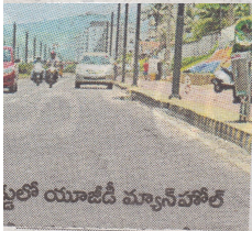
లో యూజిడి మ్యూన్సిపాలిటీ